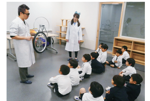
科学実験プログラムの様子