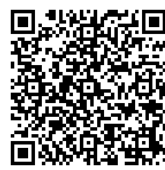
スペシャルプログラム 申込QRコード

※プログラム料金の表示を全て税込価格に変更いたしました。以前と表記が異なるため、お手数ですがご確認ください。