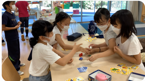
ボードゲームが大人気！