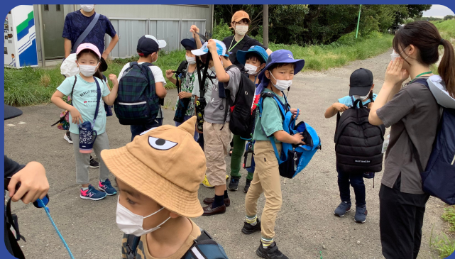
多摩川河川敷での虫取り