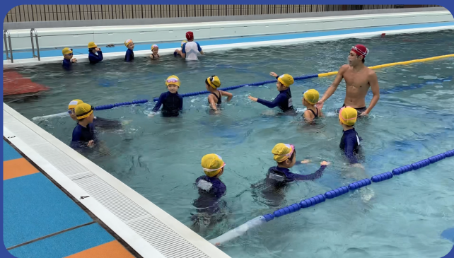
とても気持ちよさそうだったプール