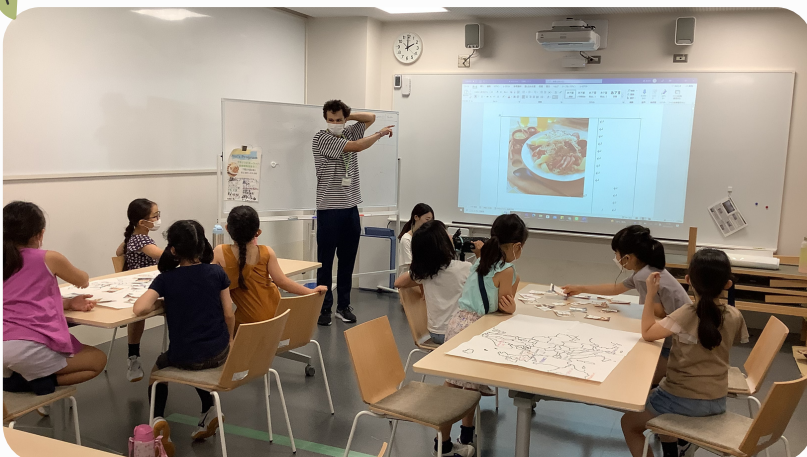
ポールが教えてくれた”世界の料理” 8月いっぱいフランスに帰ります。