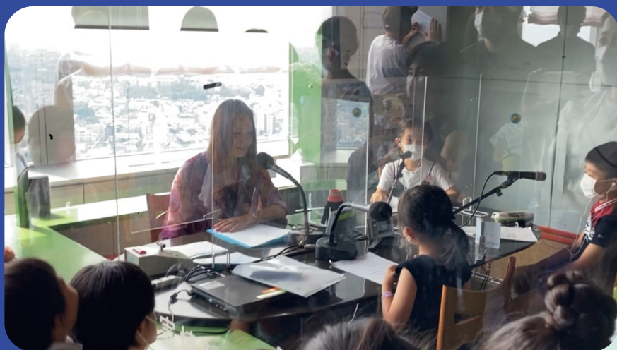
ラジオDJに挑戦！の本番収録