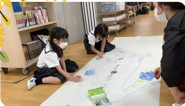
床いっぱいの紙に思いきりお絵描き！