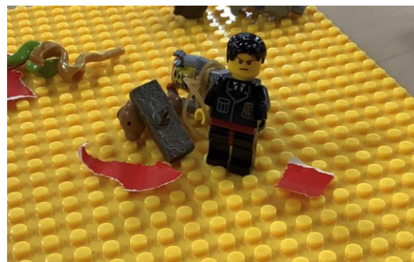
LEGOでコマドリ動画づくり