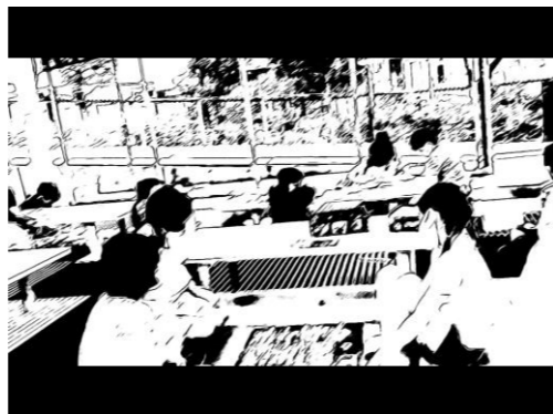
イメージに合わせて オリジナル加工にチャレンジ!