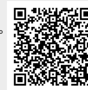
スペシャルプログラム 申込QRコード