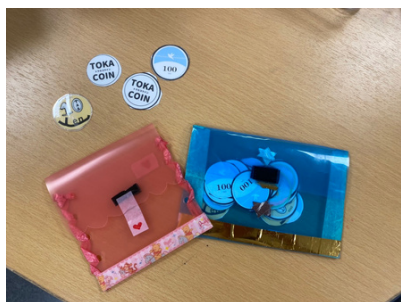
オリジナルの 財布と TOKACOIN

お財布は自分で作ることも、買うこともできますので、まだ持っていない子どもたちはぜひスタッフに声をかけてくださいね！