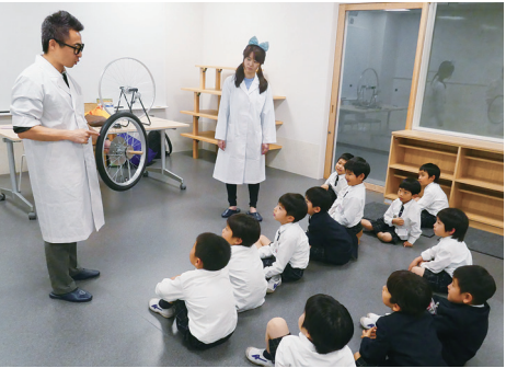
科学実験プログラムの様子