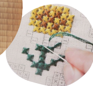
お花の刺繍ポーチ