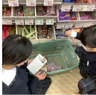
駄菓子の買い出し