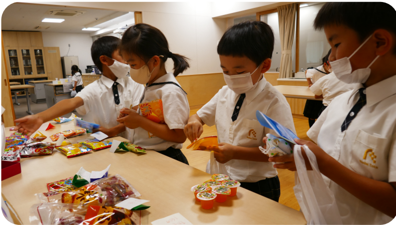
駄菓子おやつDAY当日