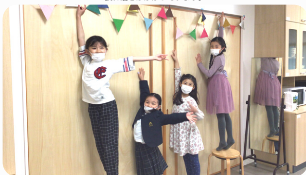
カフェの準備を頑張りました！