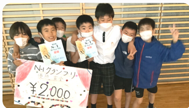
N-1グランプリ、うれしさのあまりこの躍動感！