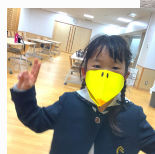
ペーパークラフト ばくばくくちばしマスク/くるくるクラフト