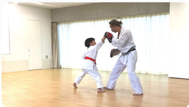
技に磨きがかかっています。