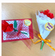
カーネーションのカード