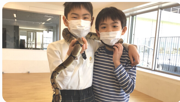
へびを巻いてピース！怖くないのかな…？