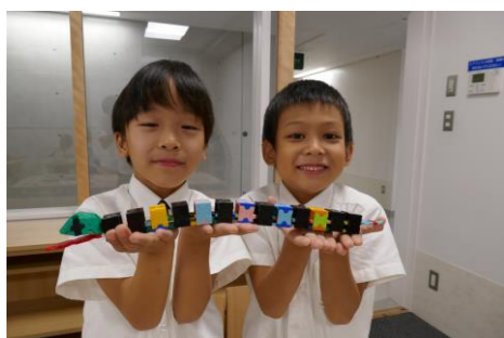
LaQ 反り返るヘビ、上手に作れました!