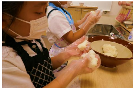
5種のおはぎづくり、きれいなおはぎの完成!